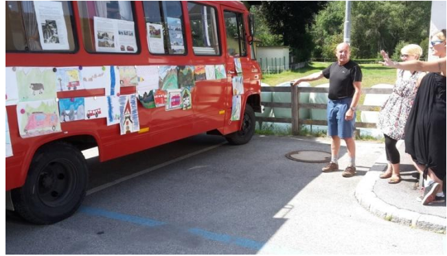
Die Jury macht sich's nicht leicht ...