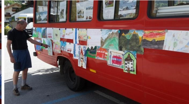
Letzte Auswahl der Preisträger aus den 3 besten von insgesamt 30 Bildern

Im August werden die Details der Preisübergabe bekannt gegeben.